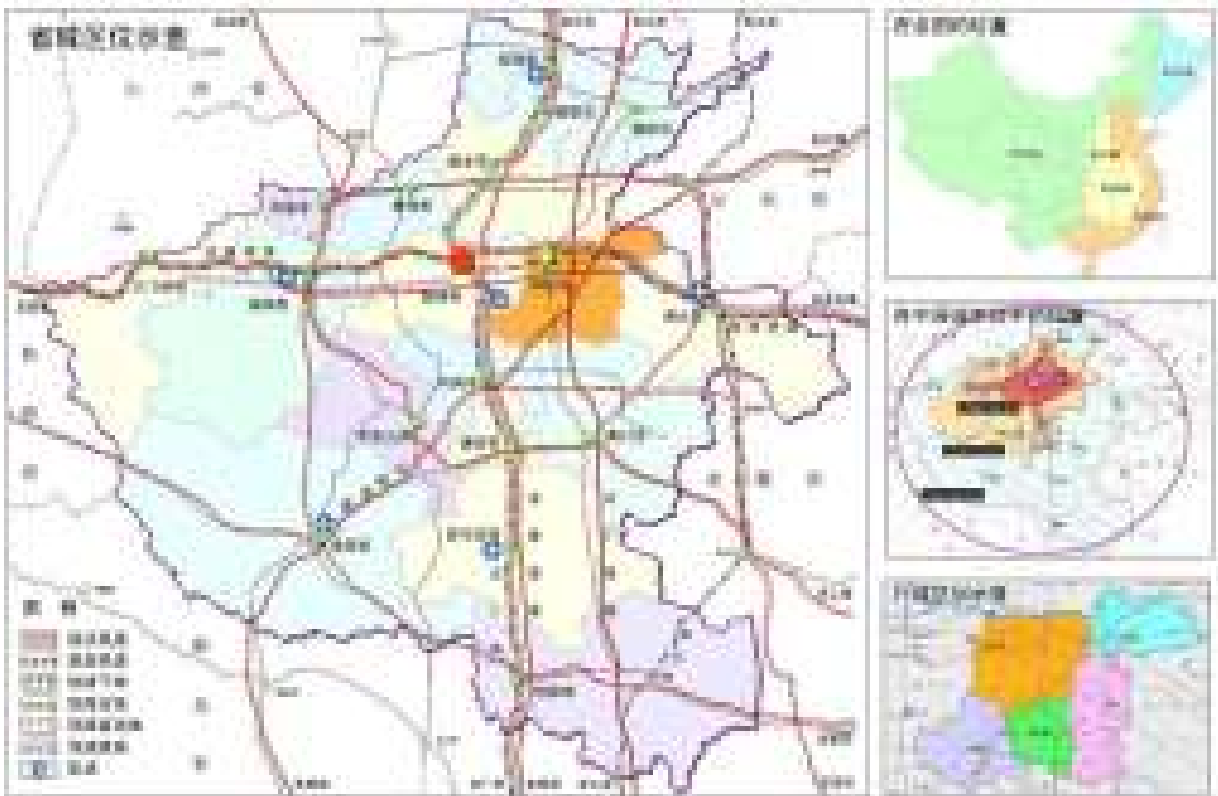
开封市地理位置图

开封是我国八大古都和国务院首批公布的 24 座历史文化名城之一。它北襟黄河，与新乡的封丘、长垣隔河相望；南挟陇海铁路，与周口市的太康、扶沟及许昌市的长葛、鄢陵相邻；东与商丘的民权、睢县接壤；西接省会郑州的新郑和中牟。全市土地面积 6240.26km 2 ，市区面积 546km 2 。其境内有多条铁路、公路干线穿过，交通便利，四通八达。