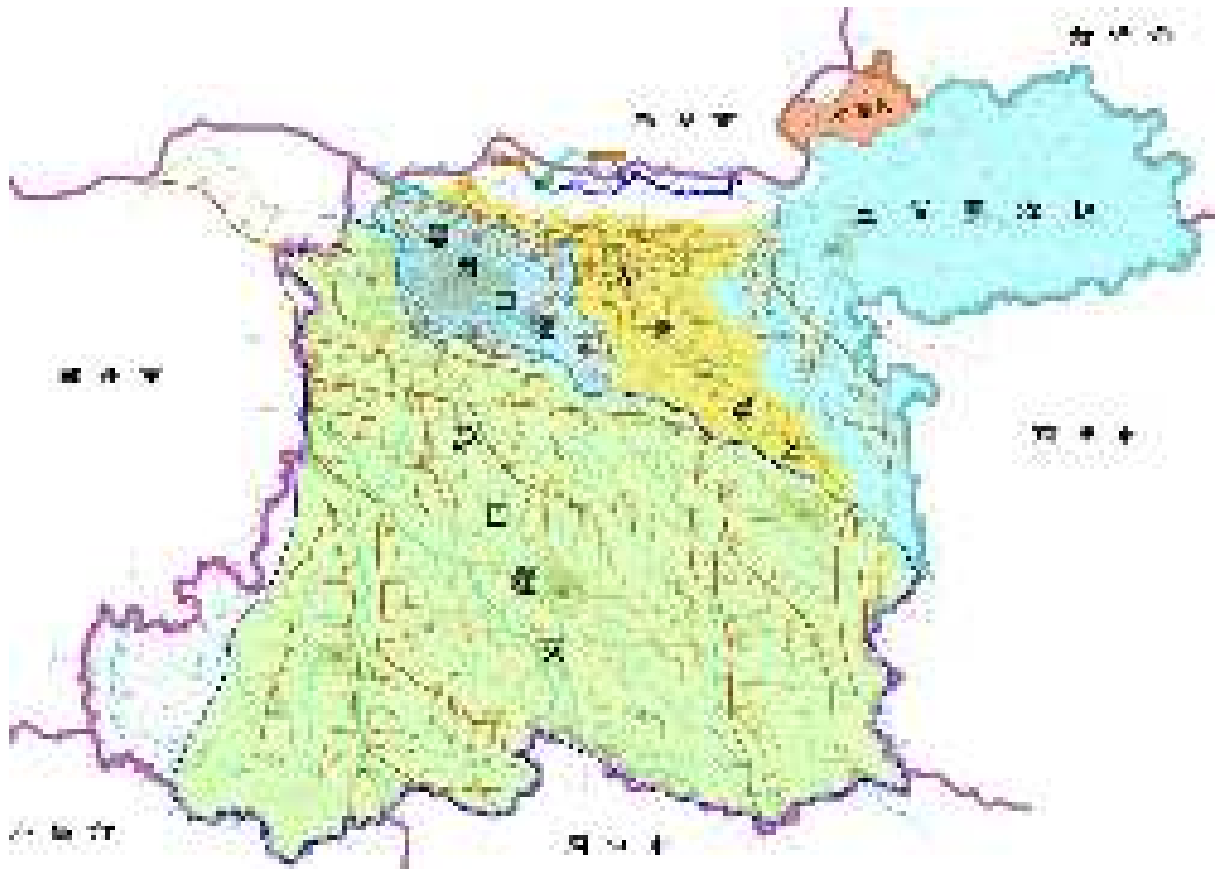
开封市大中型灌区图