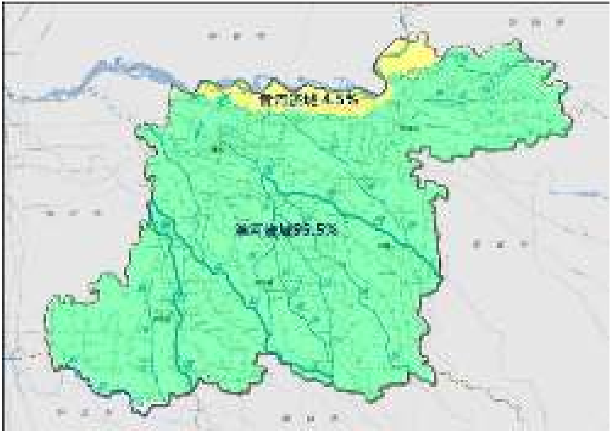
开封市流域分区图

属黄河流域，约占开封市总面积的 4.5%；其余均属淮河流域，约占开封市总面积的 95.5%。