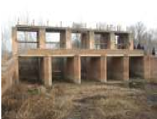
金村闸主体现状图

患的 13 座病险水闸有序开展除险加固，消除安全隐患，完善配套管理设施，恢复水闸调节作用，保障水闸的安全运行，有效保护下游人民群众和基础设施的安全。同时，加强监测预警设施的建设，健全常态化的管护机制，确保水利工程安全长久运行。