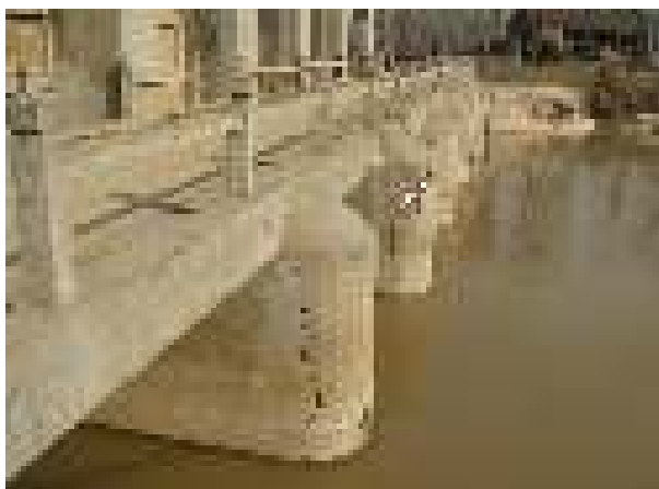
王庄闸下游闸墩裂缝