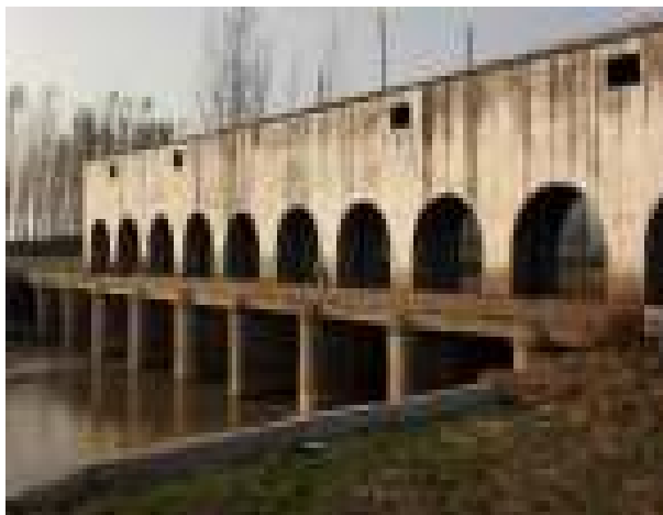
黑木闸主体现状图