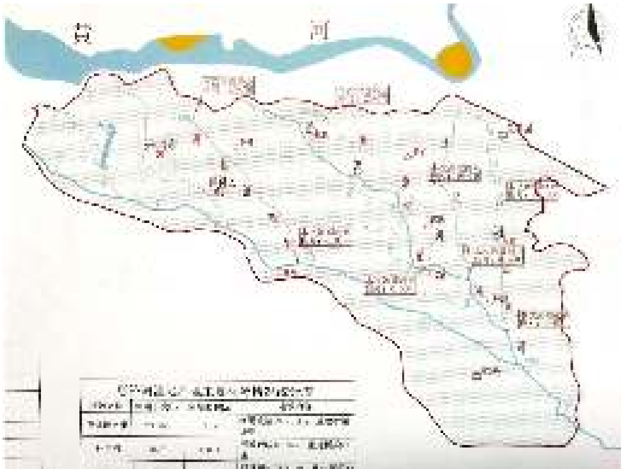
洼地治理工程规划布局图