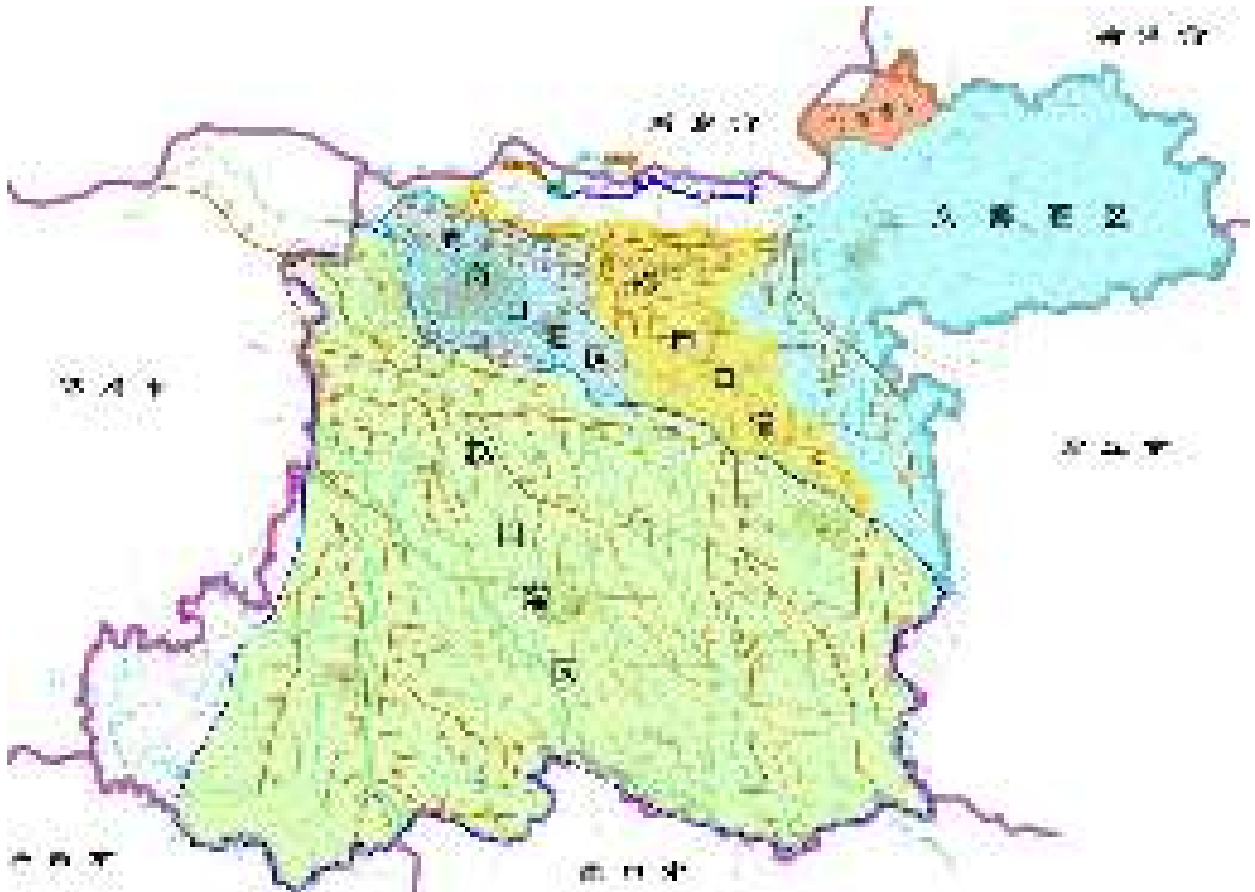
开封市灌区现状图