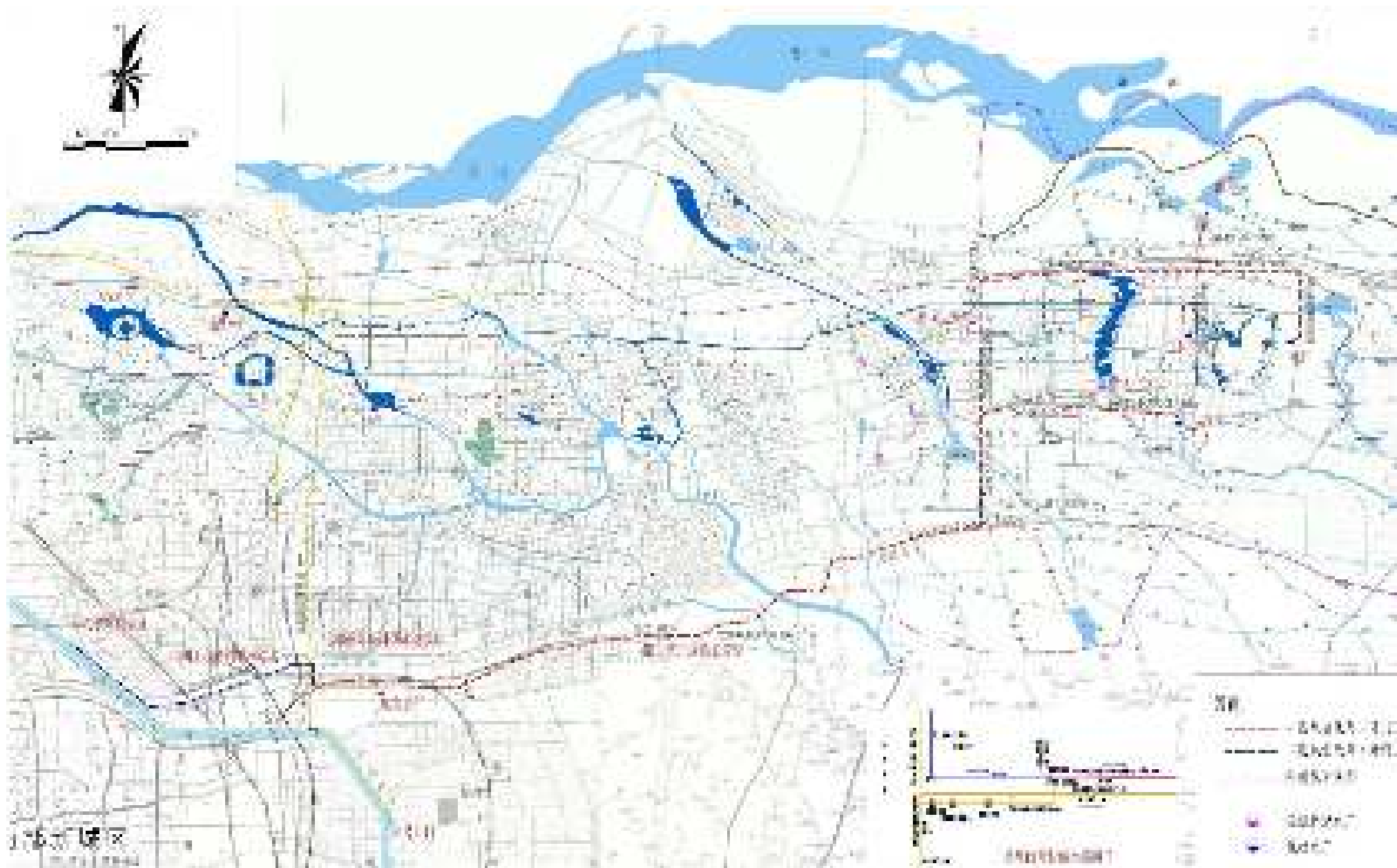
郑开同城东部供水工程总平面示意图