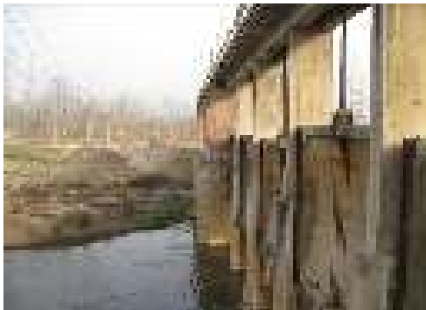
罗寨闸闸门铁件锈蚀