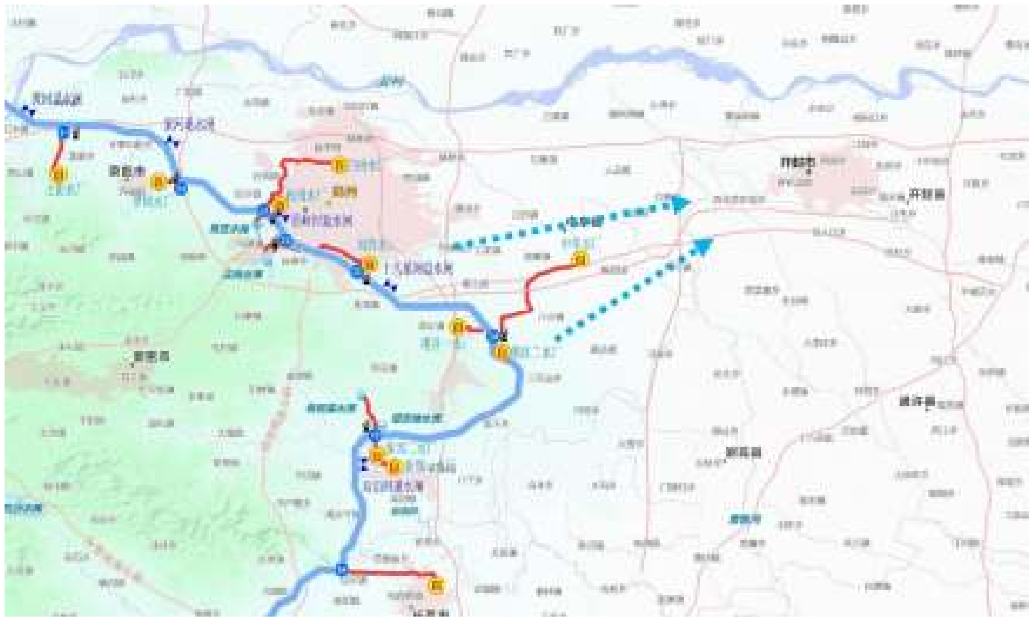
受水目标（开封市）与南水北调中线干线位置关系图