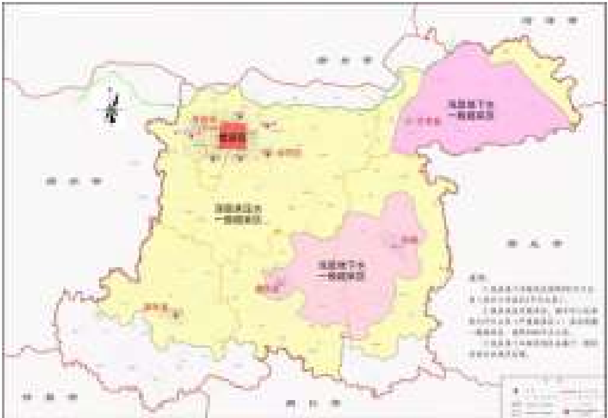
开封市地下水超采区、禁采区分布图

政府《关于公布全省地下水禁采区和限采区范围的通知》（豫水政资〔2014〕76号），规定开封市深层承压水禁采区：东界至劳动路，南界至郑汴路，西界至夷山大街，北界至东京大道，面积33km 2 。地下水持续超量开采，造成地下水位不断下降，同时引发地面沉降、水质污染等一系列生态环境地质问题。